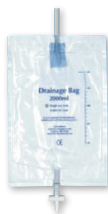
NOČNÉ ZBERNÉ VRECKO